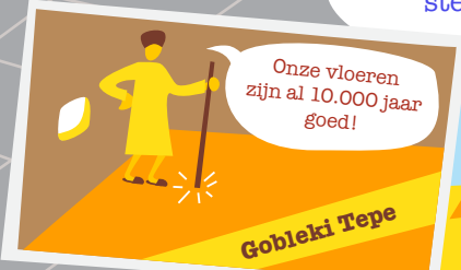
Gobleki Tepe - 8000 v.Chr.

Mensen plakken al duizenden jaren stenen aan elkaar.