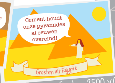
Pyramides van Gizeh - 2500 v.Chr.

Maar we maken er wel stenige dingen van!